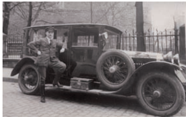
Über 100 Jahre Reisetradition: Mit einem Pferdewagen- und Taxibetrieb fing 1898 alles an.

50 Jahre Saarland – das ist auch die fünfzigjährige Geschichte der Menschen, die hier leben, und der Unternehmen, die im Saarland zu Hause sind.