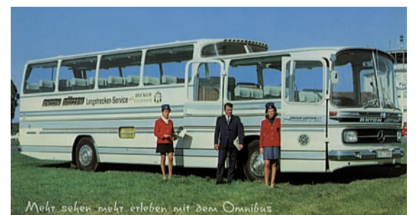
1970: Mit „Jet-Atmosphäre nach Spanien“ im Mercedes Super-Pullman.