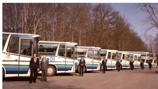
Technologisch immer auf der Höhe der Zeit: Die Göttten-Busflotte mit Fahrern in den 70er Jahren.