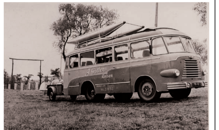
Kreativer Boots-Transport an den Bestimmungsort Comer See.