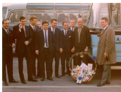
Eine große Familie: Die Erfahrung und Qualität unserer Fahrer ist etwas, auf das wir bei Anton Göttten Reisen besonders stolz sind, und an dem wir permanent arbeiten.