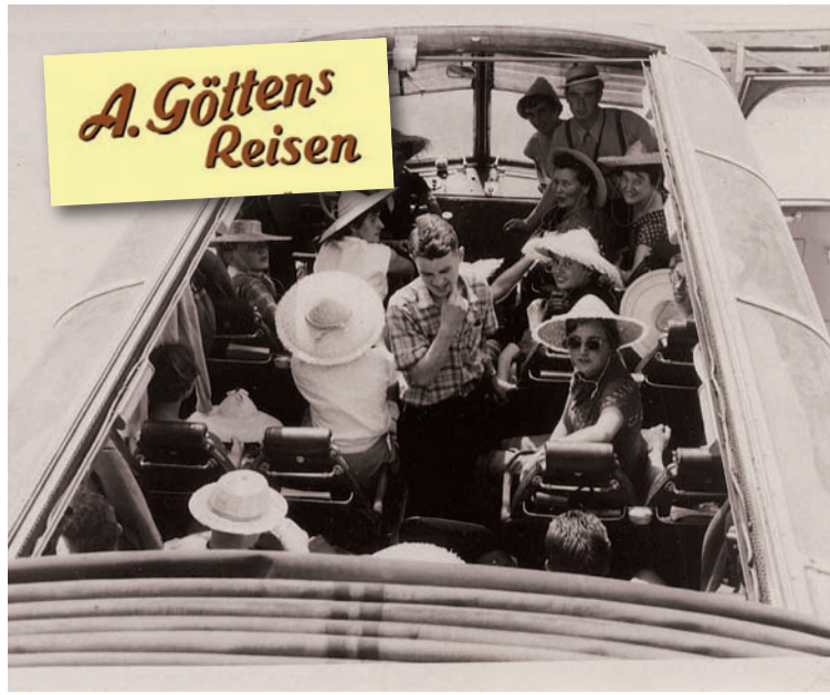
Busreisen vor 50 Jahren: Mit Cabriogefühl im Schnecken-tempo über die Alpen – der südlichen Sonne entgegen. Wie es sich für ein Familienunternehmen gehört, waren die Chefs gleichzeitig Busfahrer, Lademeister, Mechaniker, Fremdenführer und Reiseleiter.