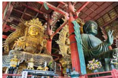
Buddha-Statuen im Tōdai-ji-Tempel in Nara