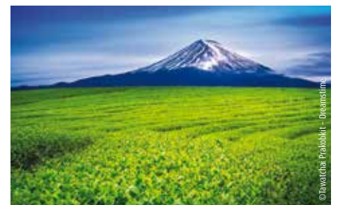
Leuchtend grüne Teefelder vor dem ikonischen Vulkan Fuji-san