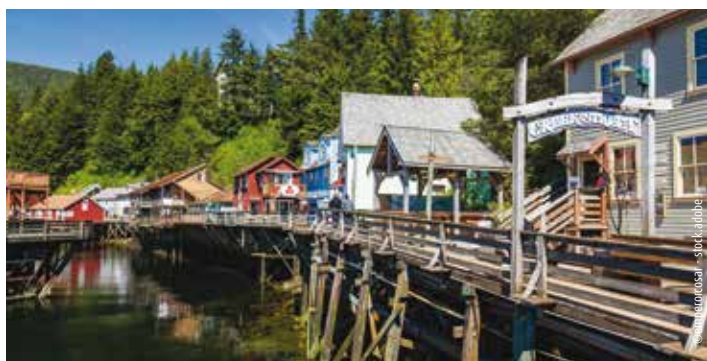
Historische Creek Street in Ketchikan

Nutzen Sie die zentrale Lage Ihres Hotels zu einem