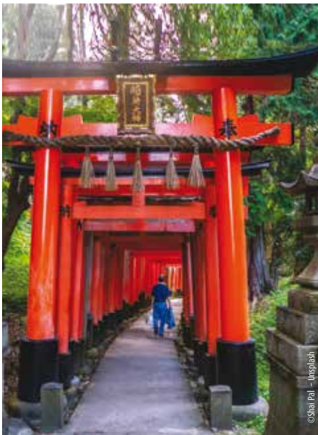
Der Fushimi Inari-Schrein in Kyoto

Transfer zum Flughafen Osaka. Flug nach Frankfurt und Bustransfer in die Zustiegsorte.