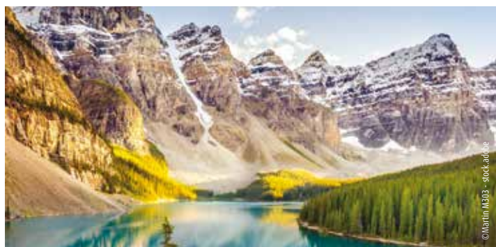
Moraine Lake im Banff-Nationalpark