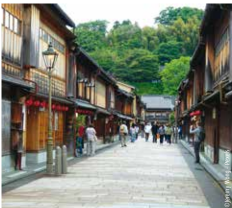
Die Altstadt von Kanazawa