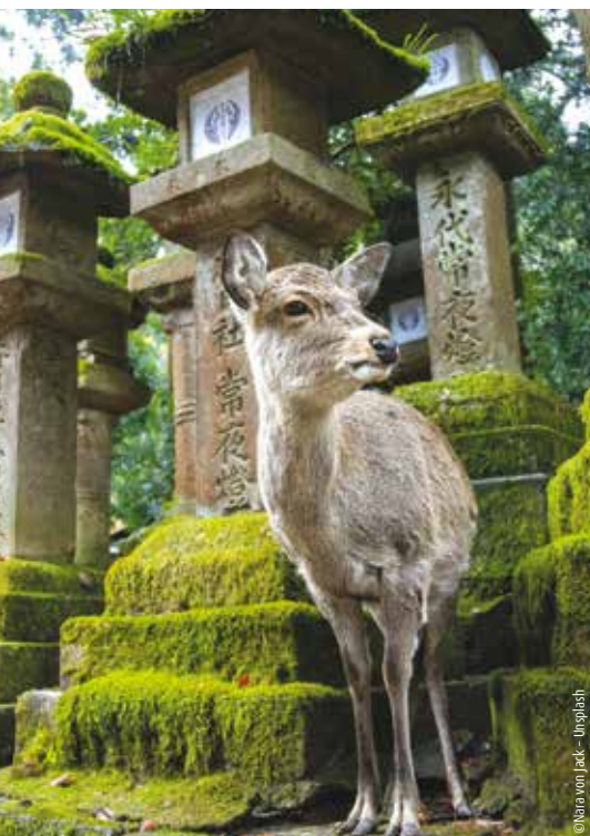
Nara-Park mit den heiligen Hirschen

Besuchen Sie den Morgenmarkt in Takayama und das UNESCO-Weltkulturerbe Dorf Shirakawago mit seinen Gasshō-Bauernhäusern. Entdecken Sie Kanazawas Geisha-Viertel mit den eleganten Holzhausern. Übernachtung in Kanazawa.