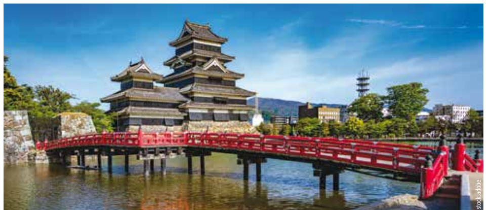
Die schwarze Matsumoto-Burg inmitten der japanischen Alpen