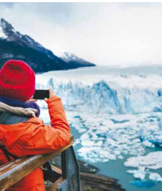
Perito Moreno Gletscher,

Ausflug zum Perito Moreno Gletscher, fakultative Bootstour. Übernachtung in El Calafate.