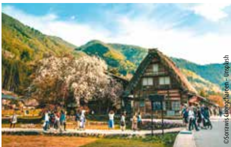
Dorf Shirakawago mit seinen Gasshō-Bauernhäusern